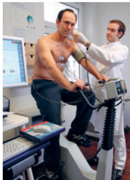
Prävention nach Maß: Bei der Bremer Gesundheitsuntersuchung stehen die individuellen Risiken des Patienten im Vordergrund.

Informationen nach Wunsch. Die Fragebögen erfassen die häufigsten Erkrankungen einer Altersgruppe. Die Patienten füllen sie vor der Untersuchung aus. Welche Gesundheitsprobleme erfasst werden, hängt dabei auch von den Präferenzen der Patienten ab. Nur wenn sie durch Ankreuzen Informationsbedarf und Gesprächsbereitschaft zu einem Thema signalisieren, spricht der Arzt das Problem auch an. „Ein Beispiel dafür ist die Harninkontinenz, für die sich viele Menschen schämen und die sie nicht von sich aus ansprechen“, sagt Guido Schmiemann, Allgemeinmediziner und einer der Initiatoren des Projekts. In so einem Fall kann der Arzt aber auch keine Hilfe anbieten.