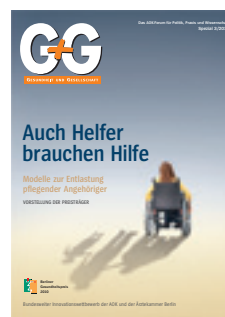
2010 Auch Helfer brauchen Hilfe