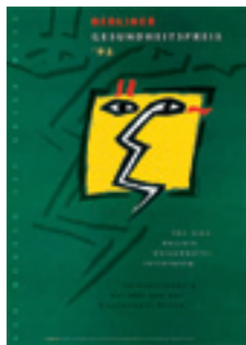
1995 Der Mensch ist unser Maß

Mit dem Berliner Gesundheitspreis zeichnen der AOK-Bundesverband, die Ärztekammer Berlin und die AOK Nordost – Die Gesundheitskasse innovative Modelle zur Gesundheitsversorgung aus.