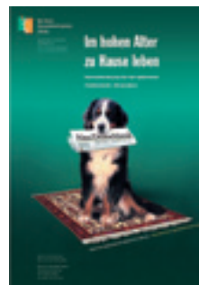
2006 Im hohen Alter zu Hause leben