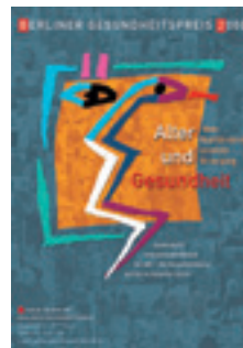
2000 Alter und Gesundheit – mehr Qualität durch vernetzte Versorgung