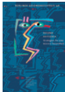
1998 Gesundheitsziele – Strategien für eine bessere Gesundheit