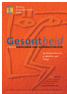
2002 Qualitätsoffensive in Medizin und Pflege