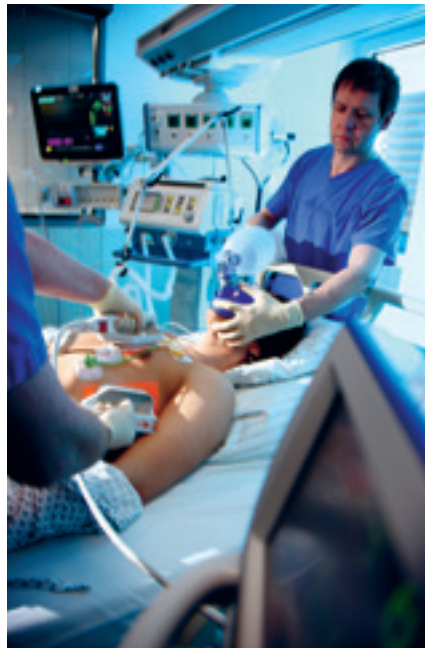
Eine leitliniengerechte Therapie verbessert die Heilungschancen von Herzinfarktpatienten.

Die beteiligten Krankenhäuser erhalten Jahresberichte, die ihnen ihre Behandlungsqualität im Vergleich zu den anderen Teilnehmern widerspiegeln. Darüber hinaus vergleicht das BHIR die Daten der einzelnen Krankenhäuser auch untereinander. „Wir erheben und analysieren aber nicht nur Daten, sondern agieren auch als Netzwerk. Den teilnehmenden Kliniken bieten wir ein Forum, um konstruktiv