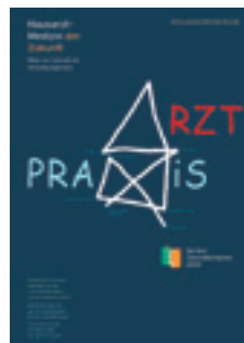
2004 Hausarztmedizin der Zukunft – Wege zur innovativen Versorgungspraxis